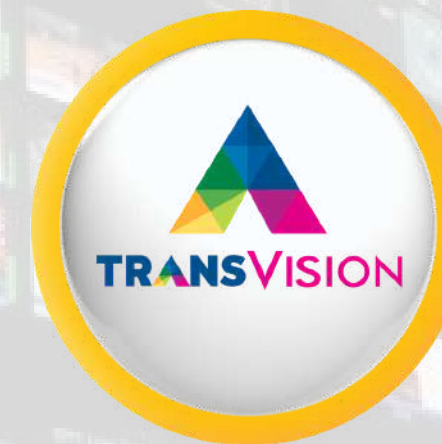
PT Indonusa Telemedia