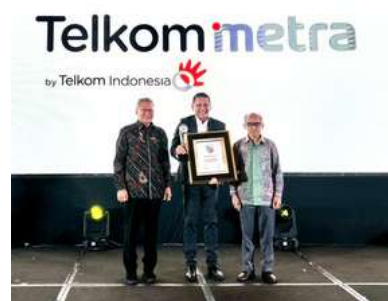
CGPI Awards: Most Trusted Company of Indonesia Good Corporate Governance Awards 2025