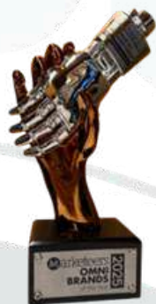
OMNI Brand of The Year 2025 (OmniX AI-Contact Center) AI-Based Customer Service Platform Marketeers