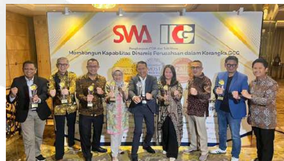
Seluruh entitas TelkomMetra Group berhasil mendapatkan predikat Trusted Company pada ajang CGPI Award 2025