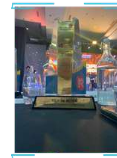
CFRO Forum 2024: Best Active Contributor in ERM Online