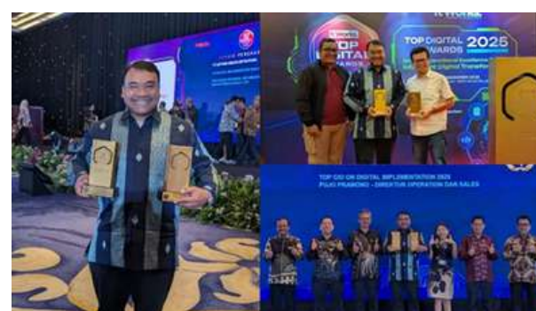
TOP Digital Awards 2025 Innovative Business Solutions • TOP Digital Implementation 2025 #Star 4 • TOP Leader on Digital Implementation 2025