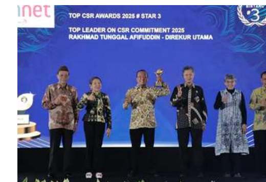
TOP CSR Awards 2025 Majalah Top Business • TOP CSR Awards 2025 • TOP Leader on CSR Commitment 2025