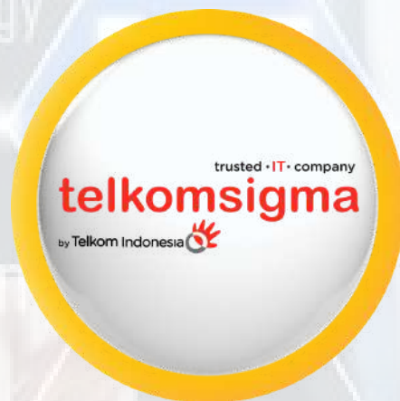
PT Sigma Cipta Caraka