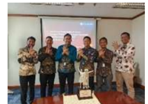
Penghargaan BI Award sebagai Mitra Sirkulasi Rupiah Nusantara Terbaik 2025