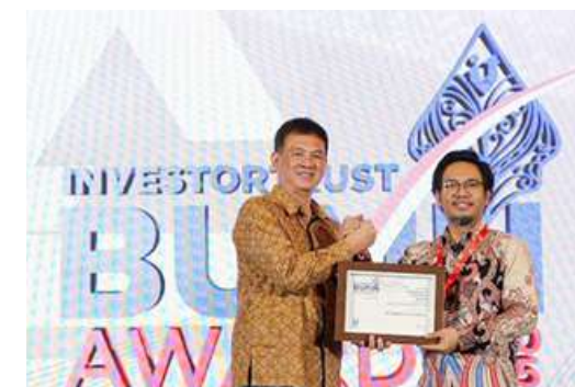
Excellence in Health Insurance Infrastructure Investortrust.id BUMN Awards 2025